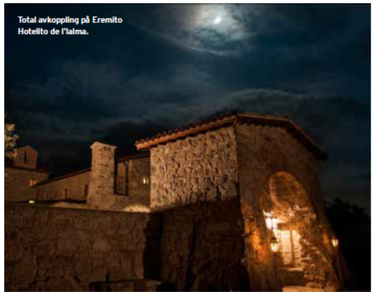
Total avkoppling på Eremito Hotelito de l'Alma.