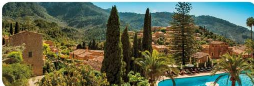
Belmond La Residencia