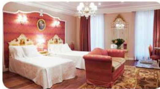
Gran Hotel La Perla