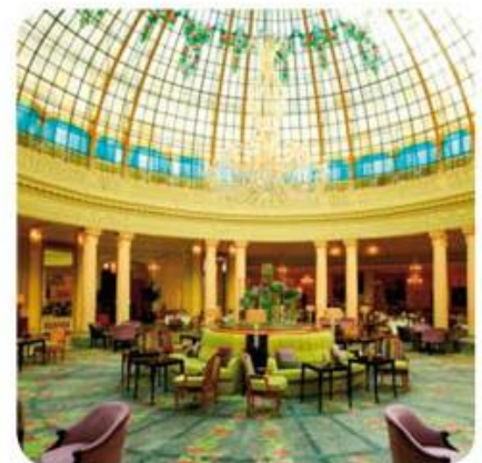
The Westin Palace