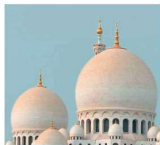
MAGAZINE Abu Dhabi rising DI REDAZIONE 9 MAGGIO 2016