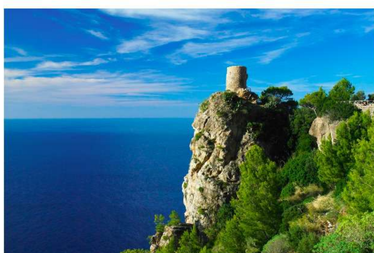
Mirador de Ses Animes

Must-see: Cabo Girão, Pico Ruivo, Madeira Botanical Garden.