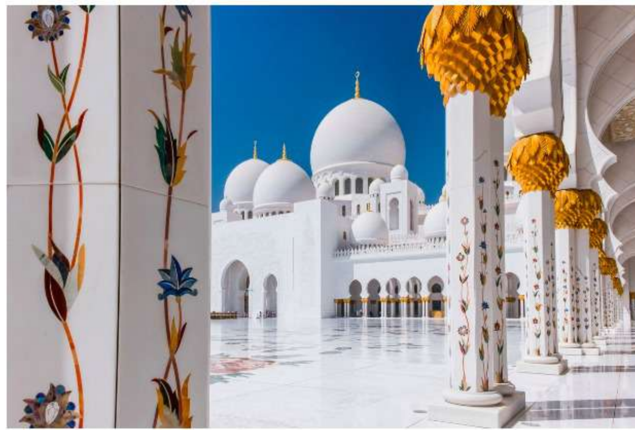
Sheikh Zayed Grand Mosque

Se c'è un periodo favorevole per un weekend lungo è sicuramente il Ponte dell'Immacolata : quattro giorni consecutivi da dedicare all'esplorazione di nuove mete, più o meno lontane, ma facilmente raggiungibili dall'Italia. E dato che l'inverno ormai è arrivato, portandosi dietro freddo e torpore, abbiamo deciso di dirigerci verso destinazioni più calde e, soprattutto, vista mare. Perché si sa, il lusso di godersi una spiaggia a dicembre non ha prezzo.