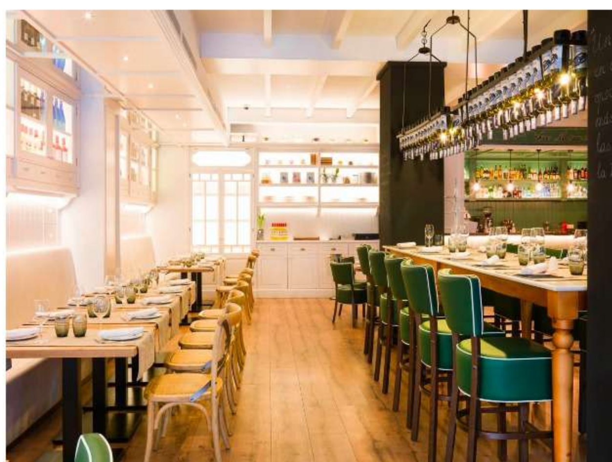
15/15 La Mémé