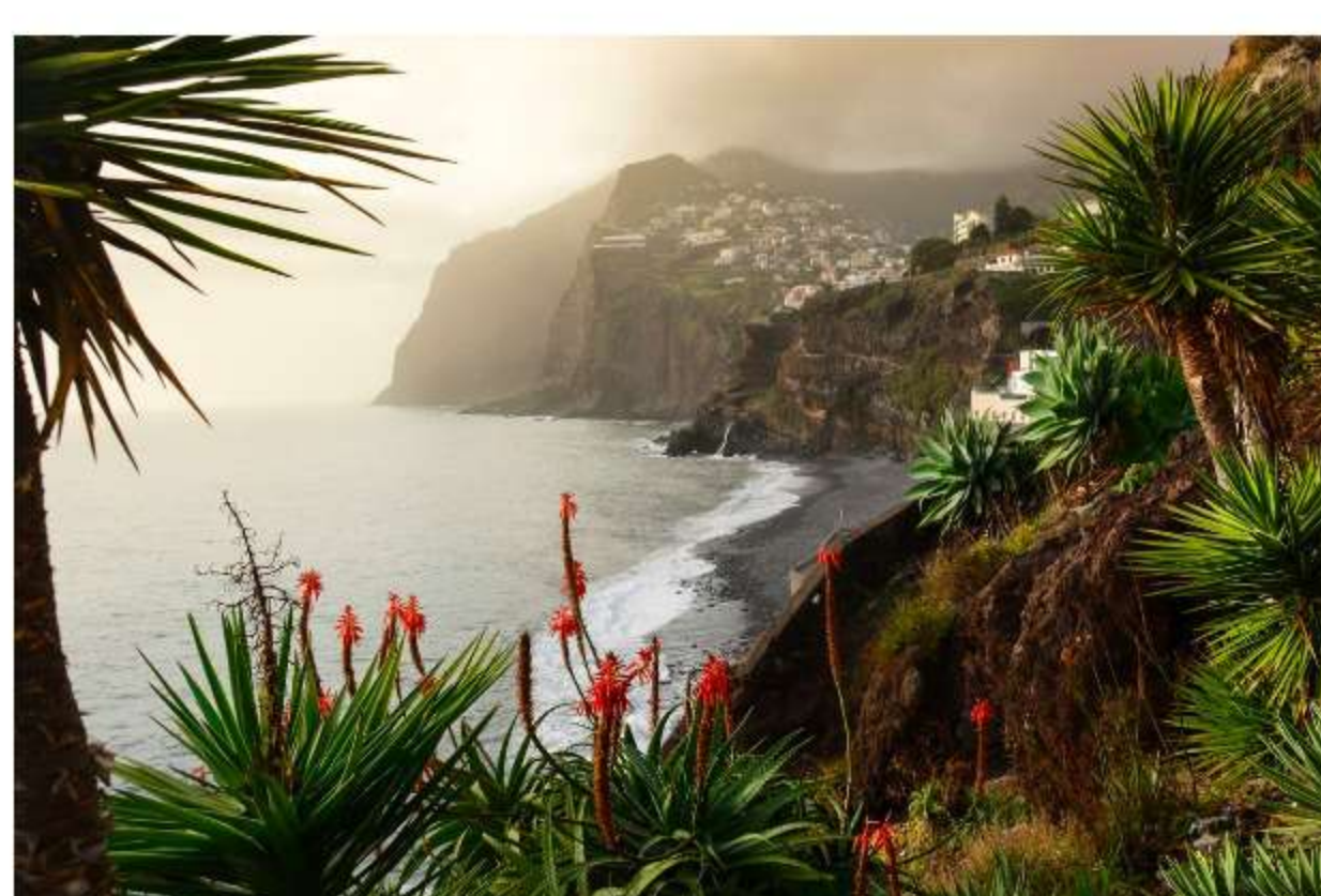
Cabo Girão

Must-see: Louvre Abu Dhabi, The Galleria Mall, Grande Moschea Sheikh Zayed