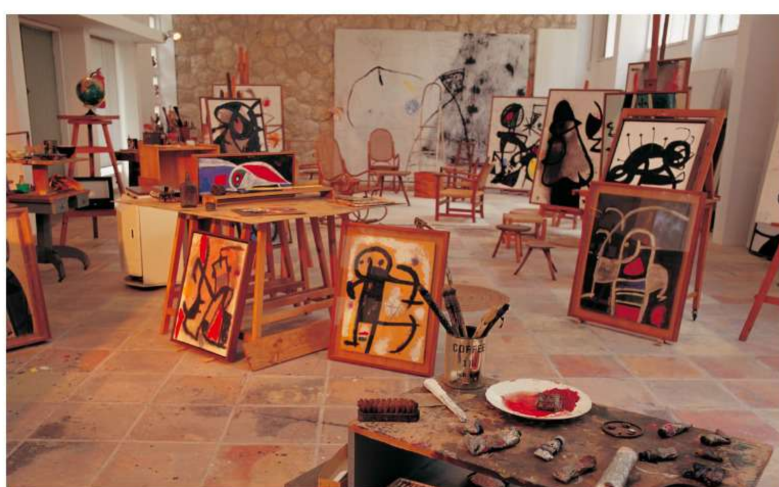
13/15 Fundació Miró