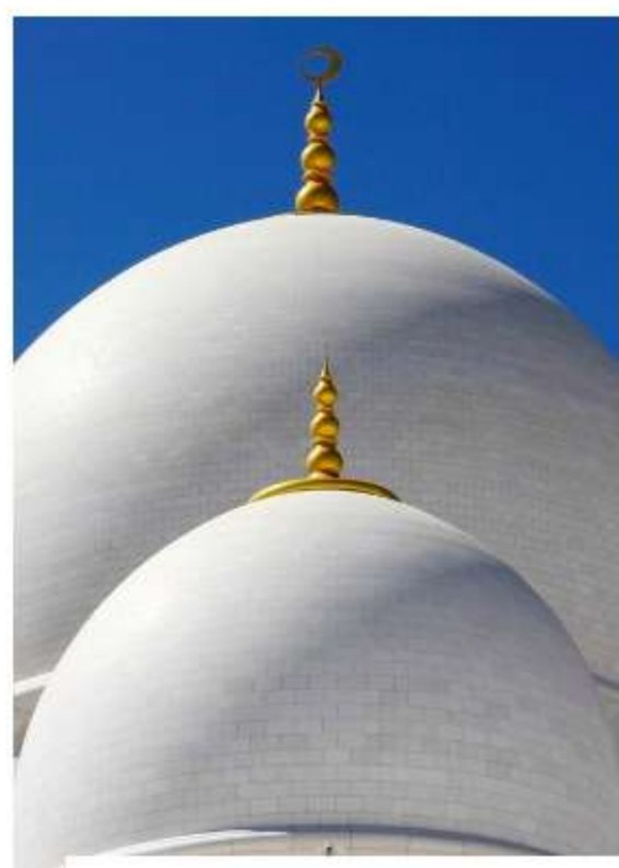
MAGAZINE DI REDAZIONE 9 MAGGIO 2016