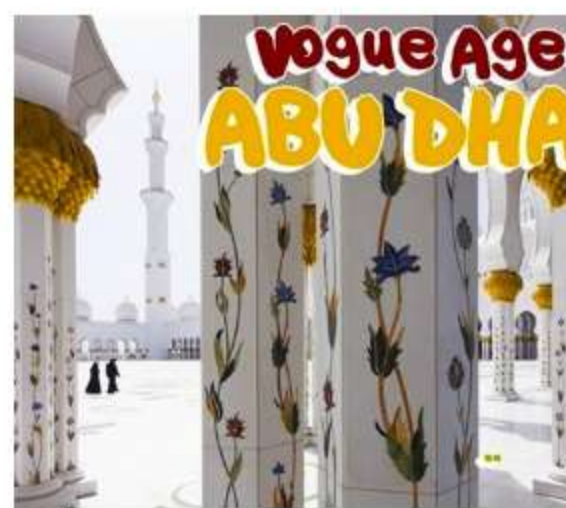
NEWS Abu Dhabi DI MIKAELA BANDINI 16 DICEMBRE 2011