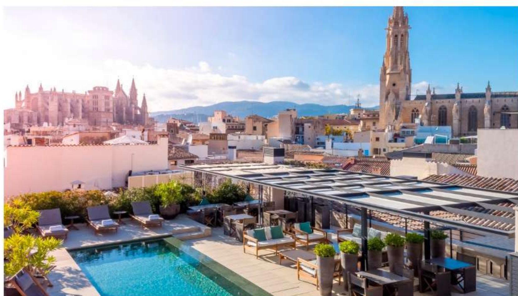
14/15 Sant Francesc Hotel Singular