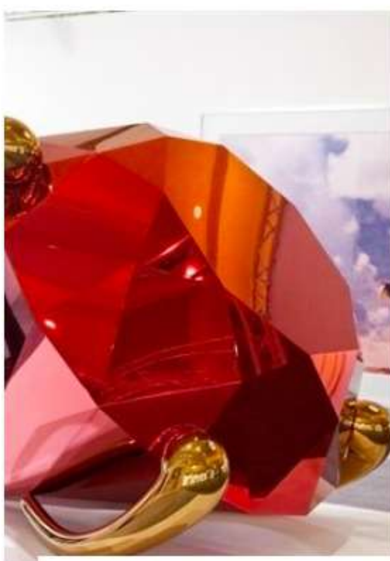
NEWS Abu Dhabi DI CARLOTTA LOVERINI BOTTA