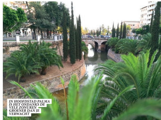
IN HOOFDSTAD PALMA IS HET ONDANKS DE VELE ZONUREN GROENER DAN JE VERWACHT