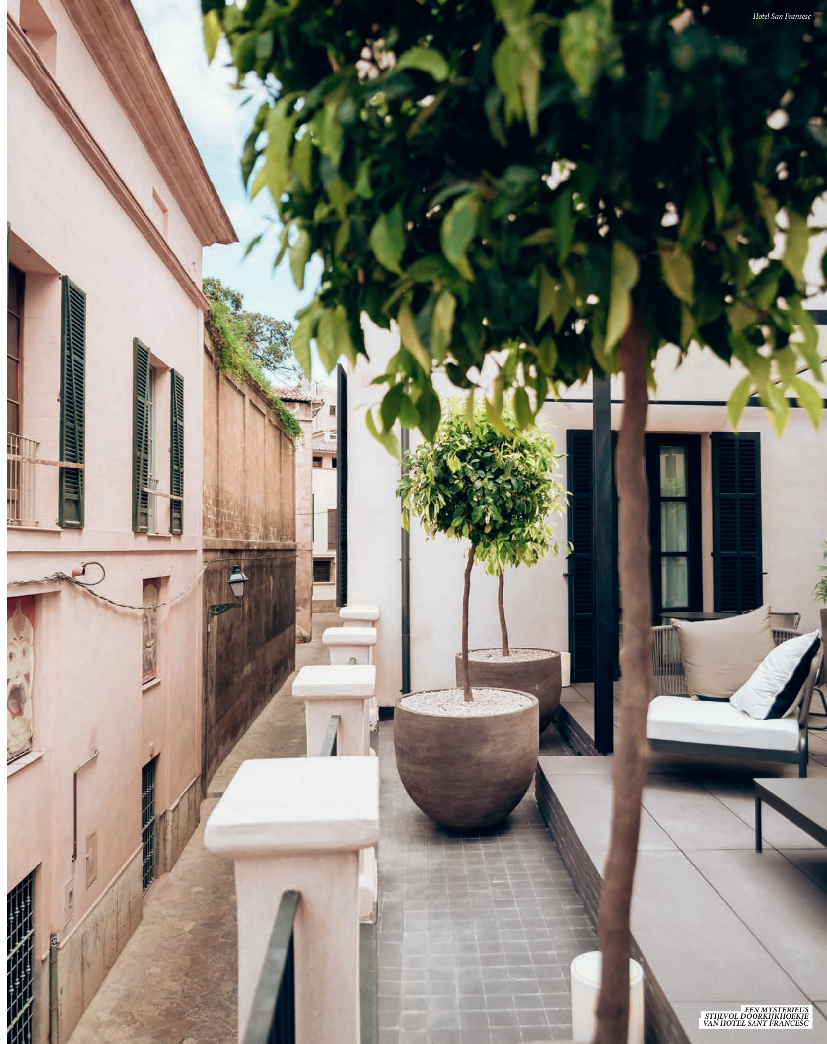
EEN MYSTERIEUS STIJLVOL DOORKIJKHOEKJE VAN HOTEL SANT FRANCESC