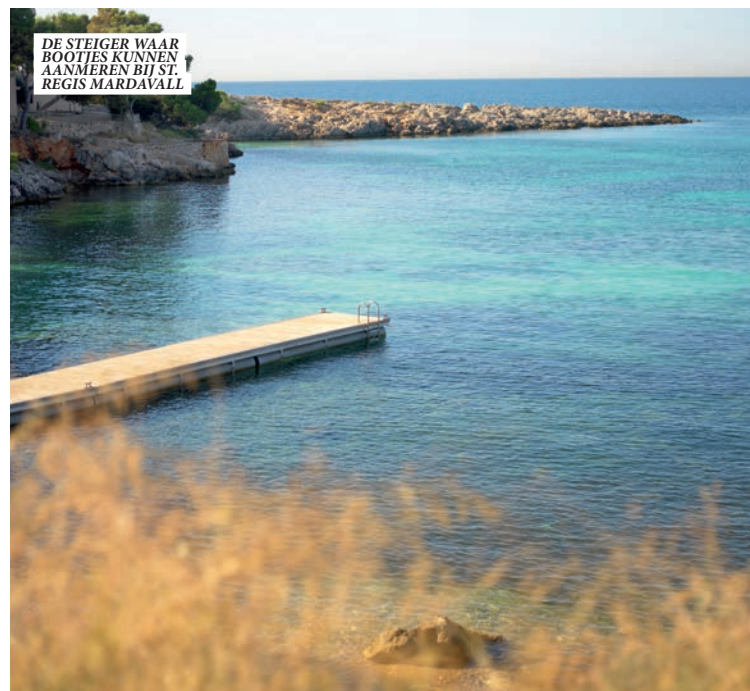
DE STEIGER WAAR BOOTES KUNNEN AANMEREN BIJ ST. REGIS MARDAVALL