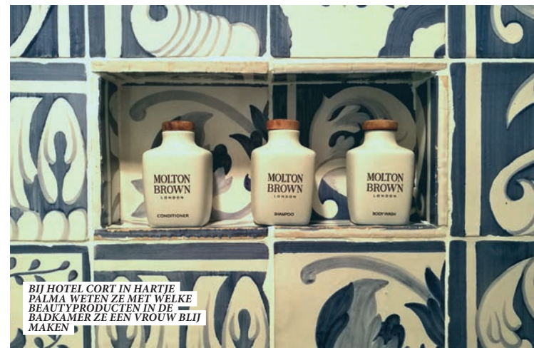
BIJ HOTEL CORT IN HARTJE PALMA WETEN ZE MET WELKE BEAUTYPRODUCTEN IN DE BADKAMER ZE EEN VROUW BLIJ MAKEN

NATURA: Wierook, geurkaarsen, body care en kleding. Je vindt het allemaal bij Natura, een soort hip reformhuis met originele 'healing' items voor body en soul. ■