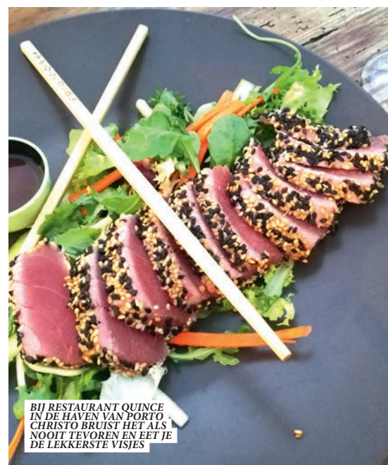
BIJ RESTAURANT QUINCE IN DE HAVEN VAN PORTO CRISTO BRUIST HET ALS NOOIT TEVOREN EN EET JE DE LEKKERSTE VISJES