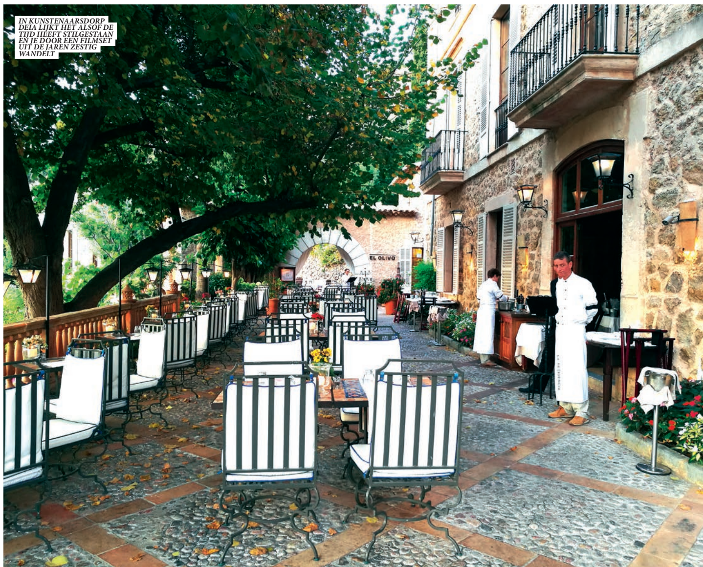
IN KUNSTENAARSDORP DEIA LIJKT HET ALSOF DE TIJD HEEFT STILGESTAAN EN JE DOOR EEN FILMSET UIT DE JAREN ZESTIG WANDELT