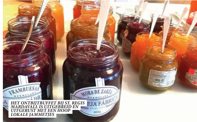
HET ONTBIJTBUFFET BIJ ST. REGIS MARDAVALL IS UITGEBREID EN UITGERUST MET EEN HOOP LOKALE JAMMETTES