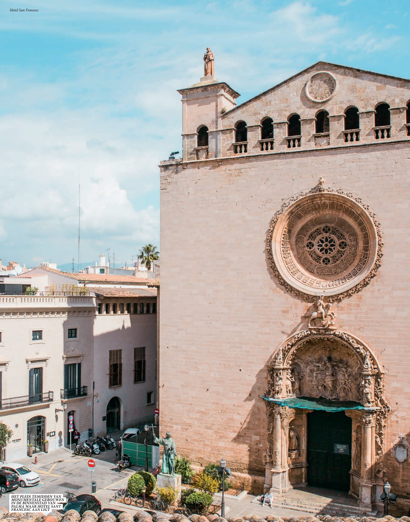
HET PLEIN TEMIDDEN VAN MONUMENTALE GEBOUWEN IN DE BINNENSTAD VAN PALMA WAAR HOTEL SANT FRANCESC AAN LIGT