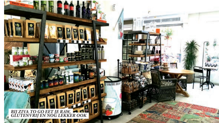
BIJ ZIVA TO GO EET JE RAW, GLUTENVRIJ EN NOG LEKKER OOK