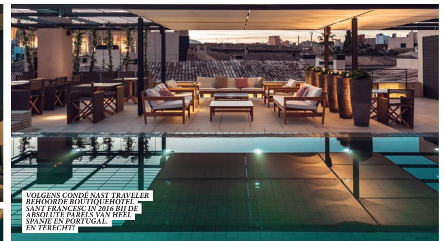
VOLGENS CONDÉ NAST TRAVELER BEHOORDE BOUTIQUEHOTEL SANT FRANCESC IN 2016 BIJ DE ABSOLUTE PARELS VAN HEEL SPANJE EN PORTUGAL. EN TERECHT!