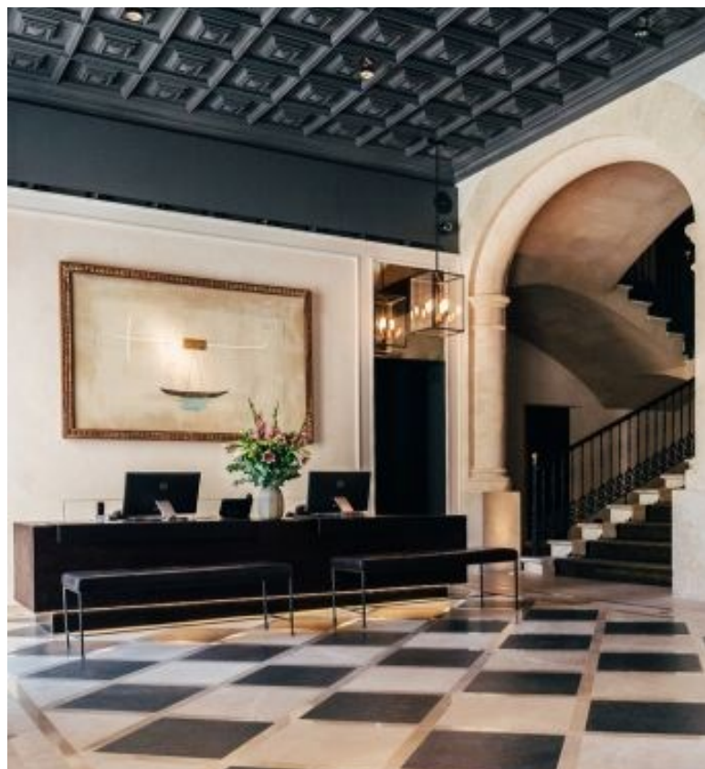
L'ingresso dell'Hotel Singular Sant Francesc a Palma di Maiorca