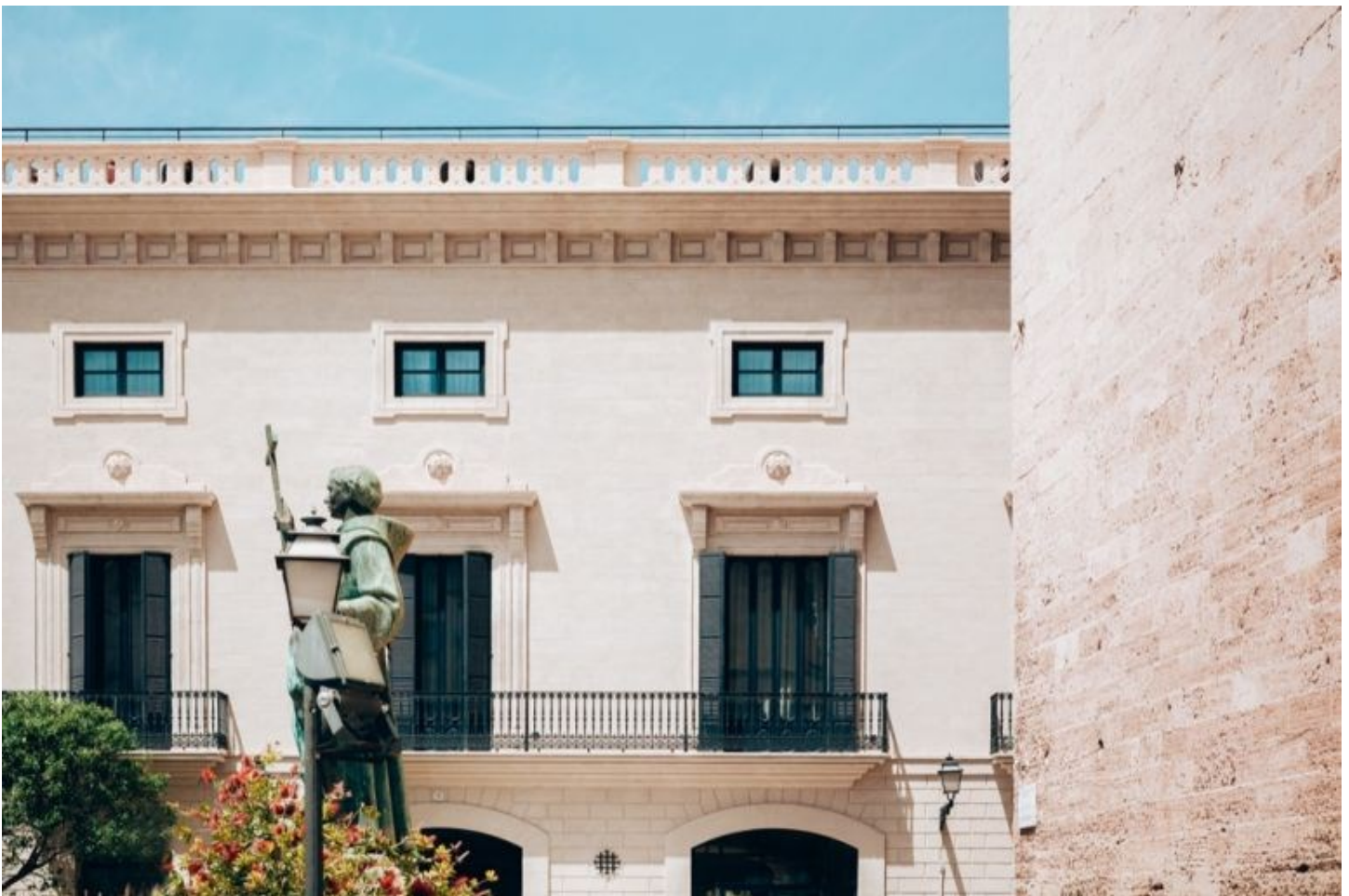
L'esterno dell'hotel, che prende il nome dalla cattedrale di Sant Francesc, costruita nel 1200