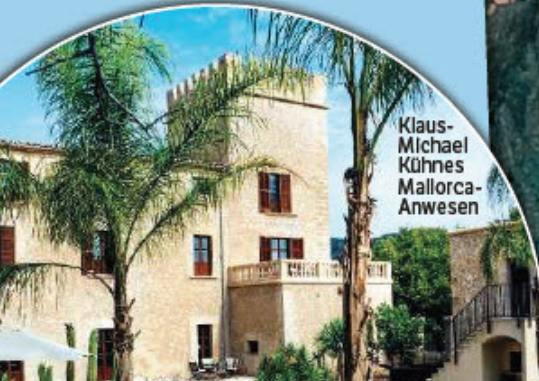
Klaus-Michael Kühnes Mallorca-Anwesen