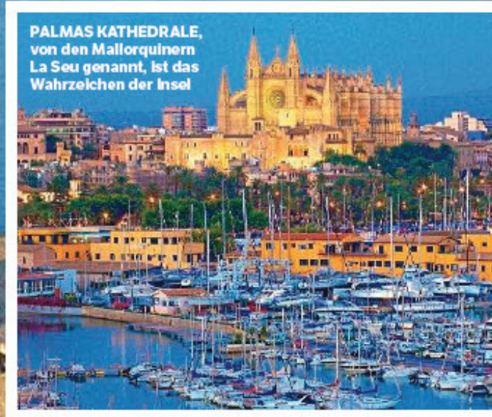
PALMAS KATHEDRALE, von den Mallorquines La Seu genannt, ist das Wahrzeichen der Insel