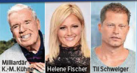
Milliardär K.-M. Kühne